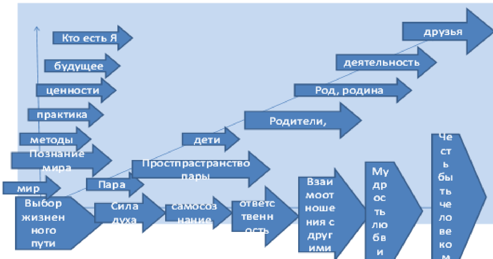
Рисунок. Три вектора функционирования ценностей в пространстве, времени и изменении в жизни личности