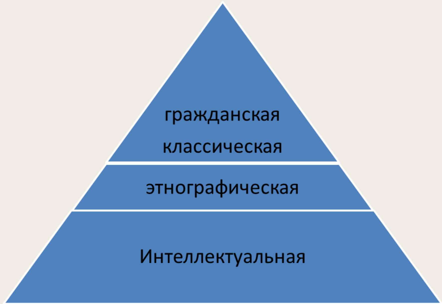
Рисунок. Исторические парадигмы в социологическом знании