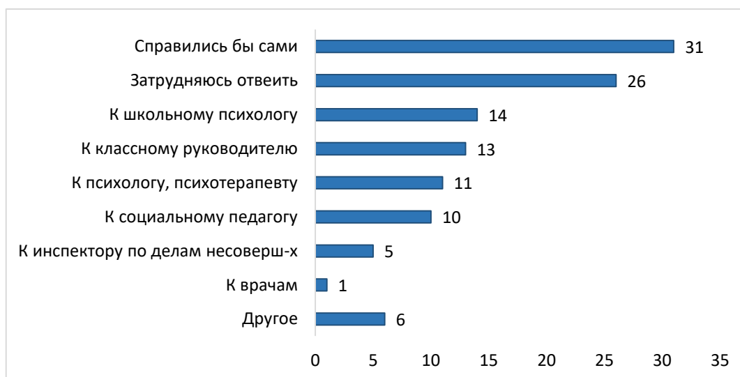
Рисунок 6. Распределение ответов на вопрос «К кому из специалистов Вы обратились бы в первую очередь, если бы у вашего ребёнка появились проблемы в поведении? % от ответивших (множественные ответы)