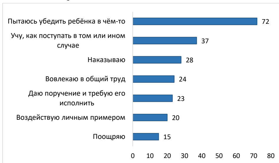
Рисунок 2. Воспитательные стратегии: распределение ответов на вопрос «К каким методам воздействия Вы чаще всего прибегаете?» % от ответивших (множественные ответы)

В деталях взаимоотношений между поколениями видны стратегии родительского влияния. Судя по ответам, родители осуществляют свою воспитательную функцию, иногда наказывая, контролируя и поучая подростка. Согласно исследованию, основным методом воспитания и воздействия на ребёнка является беседа и убеждение, на втором месте – поучения (Рисунок 2). Беседы с ребёнком родители посвящают таким темам, как: отношение к учёбе и труду (78 %), последствиям употребления алкоголя и наркотиков (61 %), отношение между полами (37 %), противоправное поведение (33 %), экстремальные и чрезвычайные ситуации (27 %), забота о своём здоровье (22 %).