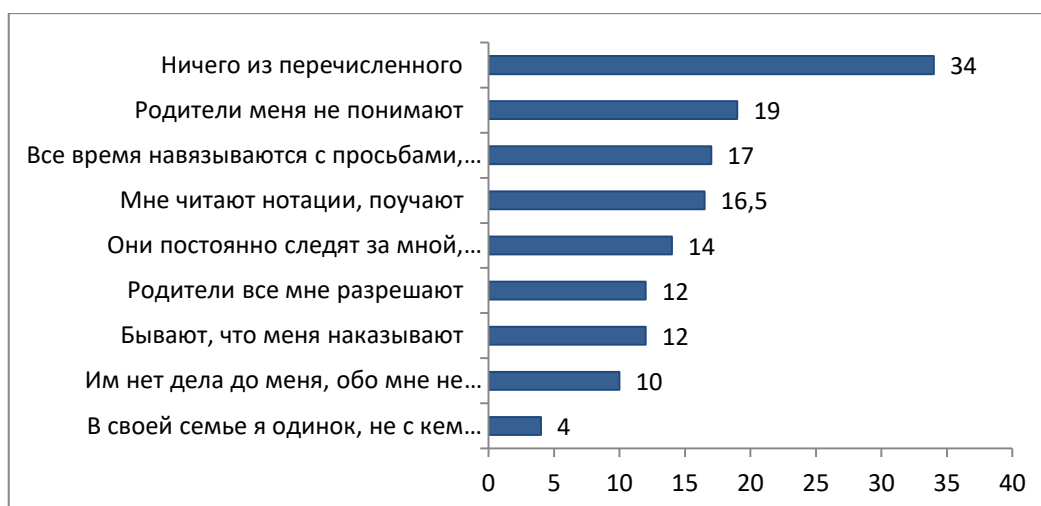
Рисунок 3. Детско-родительские отношения: распределение ответов на вопрос «Как складываются отношения с родителями?» % от ответивших (множественные ответы)

Рисунок 4 отражает «точки разногласия» между поколениями. Примечательно, что половина обсуждаемых требований воспринимается подростками с умеренной критикой (не употреблять спиртное, не приводить друзей в дом, заботиться о слабых членах семьи и др.). Яростное сопротивление вызывают требования, не соответствующие «молодёжной субкультуре»: не сидеть по ночам «в компьютере», все рассказывать, хорошо учиться и др.