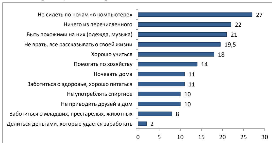
Рисунок 4. Распределение ответов на вопрос: «С какими требованиями родителей Вы чаще всего не можете мириться?», % от ответивших (множественные ответы)

Рисунок 4 отражает «точки разногласия» между поколениями. Примечательно, что половина обсуждаемых требований воспринимается подростками с умеренной критикой (не употреблять спиртное, не приводить друзей в дом, заботиться о слабых членах семьи и др.). Яростное сопротивление вызывают требования, не соответствующие «молодёжной субкультуре»: не сидеть по ночам «в компьютере», все рассказывать, хорошо учиться и др.