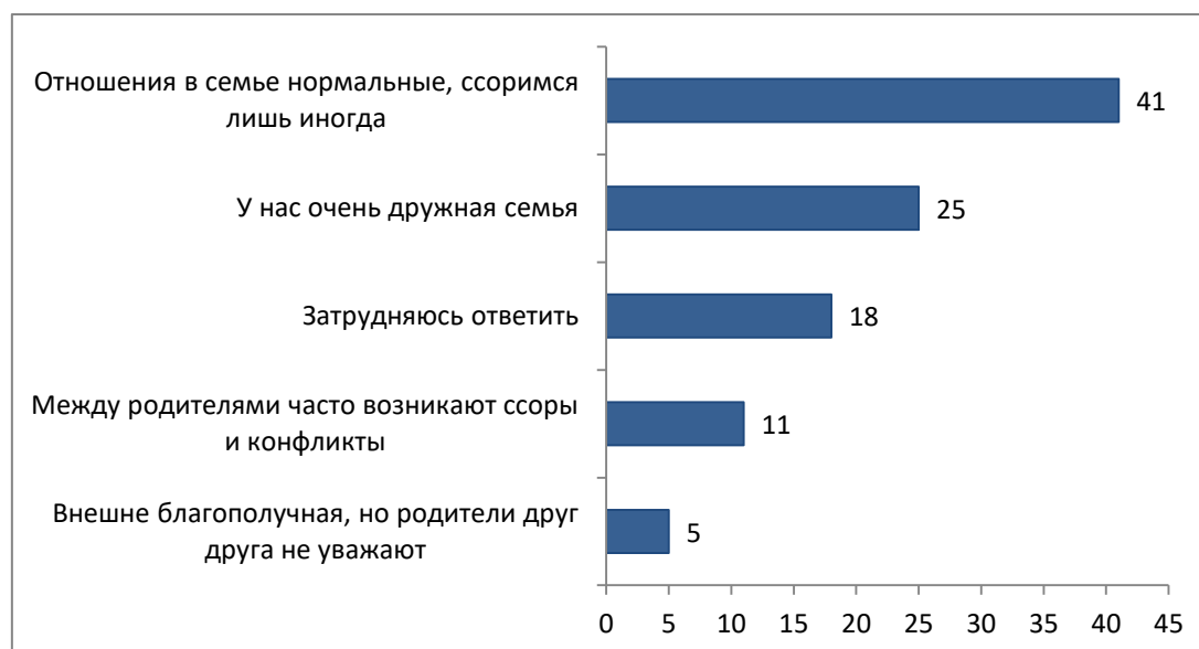
Рисунок. Семейный климат: распределение ответов на вопрос «Как Вы оцениваете отношения в семье?», % от ответивших (множественные ответы)

В то же время главным успехом в жизни для них является наличие семьи и детей (43 %), а престиж, повышенный комфорт жизни и высокая должность отходят на второй план, уступая первое место приоритету семьи.