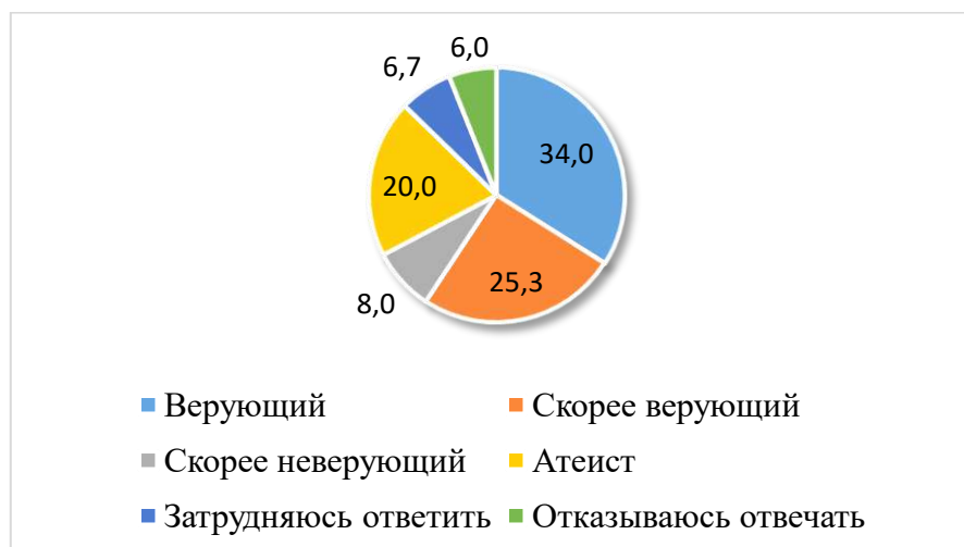
Рисунок 2. Распределение респондентов по признаку «отношение к религии», %

женщин традиционно больше на несколько процентов, в том числе и в особой демографической группе «молодежь».