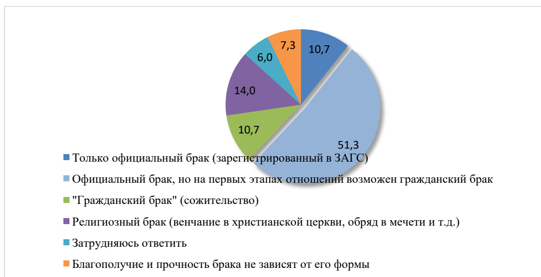
Рисунок 4. Распределение мнений респондентов по вопросу: «Какой вид союза между мужчиной и женщиной, по вашему мнению, является наиболее благополучной и прочным?»