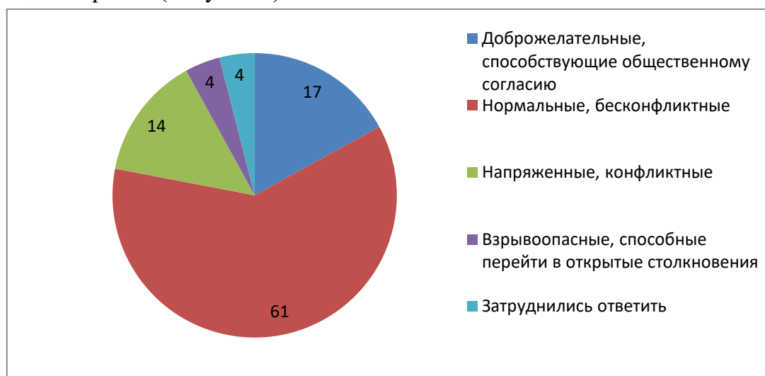
Рисунок 1. Каковы, на Ваш взгляд, отношения между людьми различных национальностей в Югре? ХМАО, 2019, %

Мансийском автономном округе – Югре, в 2019 г. должно составить – 73 %, а к моменту окончания её действия должно увеличиться до 82 %. Как выяснилось, по данным опроса оценки межнациональной ситуации, сложившейся в округе, выглядят следующим образом (Рисунок 1).