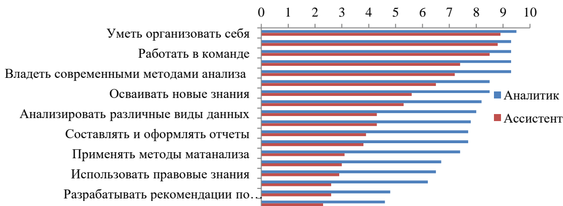
Рисунок 1. Профили компетенций ассистента и аналитика (балл по 10- балльной шкале)[Артамонова, 2015: 12]

Основным принципом оказался принцип объединения дисциплин, например «кафедра связи с общественностью, политологии, психологии и права». Такой дисциплинарный плюрализм кафедр, на которых преподается социология, предполагает, что выпускники данного направления подготовки обладают межпрофессиональной универсальностью [Гегер, Саганенко, 2018: 83]. Межпрофессиональная универсальность проявляется и в компетенциях, отраженных в мнениях работодателей о том, какими навыками должны обладать социологи (Рисунок 1).