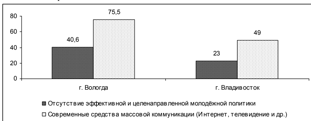
Рис. 1. Распределение ответов на вопрос «Что, на Ваш взгляд, способствует развитию молодежных субкультур?» (в % от числа опрошенных студентов)

Отсутствие целенаправленной молодежной политики выделяется каждым третьим из числа опрошенных (30%) как один из наиболее весомых факторов распространения субкультурных движений. По мнению учащихся вузов, наиболее весомым фактором распространения субкультур являются средства массовой информации. Доля студентов, разделяющих это мнение, в два раза превышает удельный вес тех, кто основную причину развития субкультур видит в отсутствии целенаправленной молодежной политики (рис. 1). Аналогичные данные были получены сотрудниками ИСЭПН РАН в ходе исследования субкультурных установок студентов Дальневосточного государственного технического университета (ДГТУ, г. Владивосток). Исследование проведено научным коллективом ИСЭПН РАН под руководством Н.М. Римашевской в 2009 г. в рамках гранта РГНФ «Социальная реабилитация лиц с девиантными модификациями поведения».