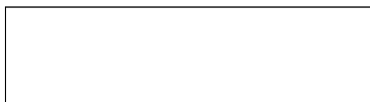
Рисунок 1 – название рисунка

Текст. Текст. Текст. Текст. Текст. Текст. Текст. Текст. Текст. Текст. Текст. Текст. Текст. Текст. Текст. Текст. Текст. Текст. «Текст. Текст. Текст. Текст. Текст. Текст. Текст. Текст. Текст. Текст. Текст. Текст. Текст. Текст. Текст. Текст. Текст. Текст.» [1 с.3]